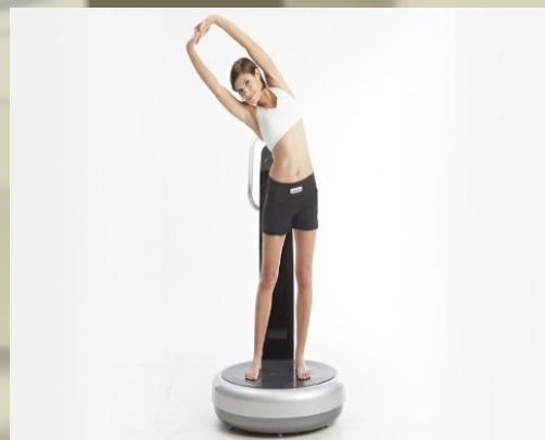
医療機器ではありませんが、ここ数年多くの 各種施設や企業様でご利用いただいております。

体の疲れとお客様との対応でメンタル的なストレスを貯めずにリフレッシュ効果が有効です